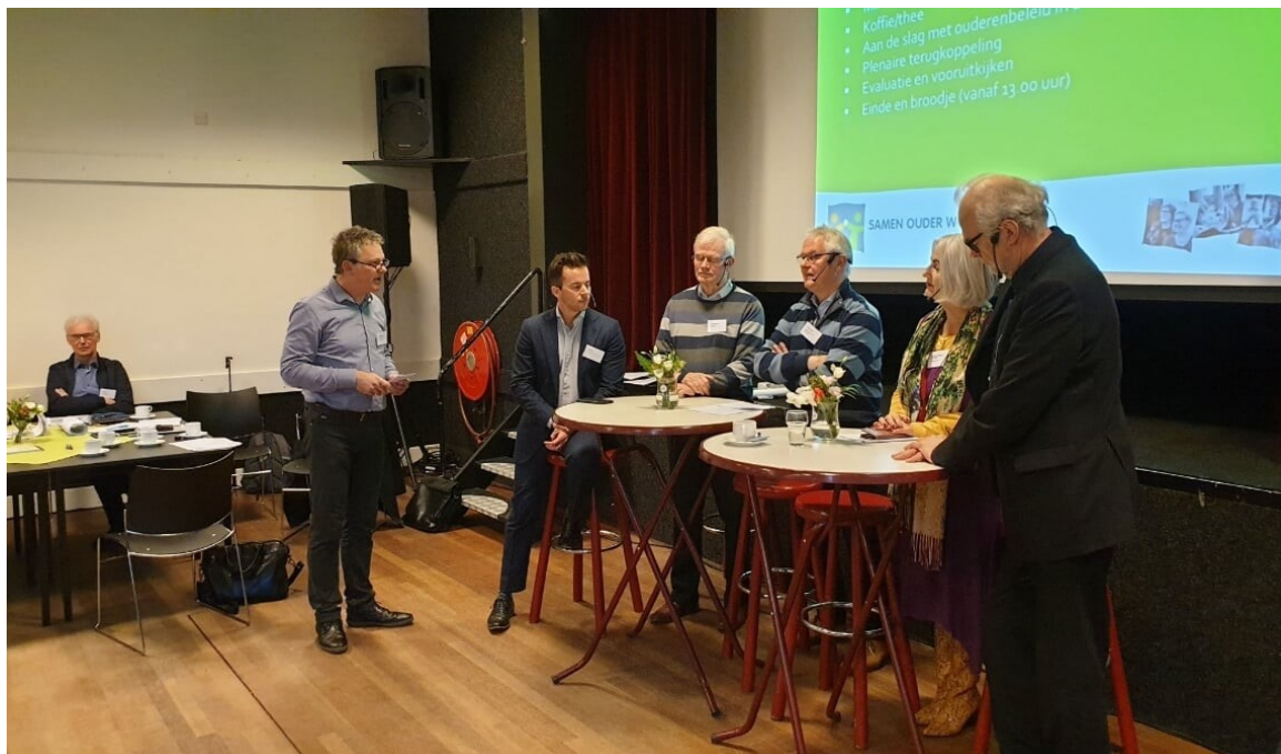
In februari was de wethouder (tweede van rechts) nog aanwezig bij een bijeenkomst van de werkgroep in De Rots. Nu lijkt de liefde tussen beiden ernstig bekoeld.