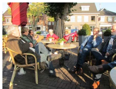
Even napraten met een goede kop koffie.

Binnenkort wordt er een excursie georganiseerd naar reeds gerealiseerde kleinschalige woonprojecten buiten Boxtel.